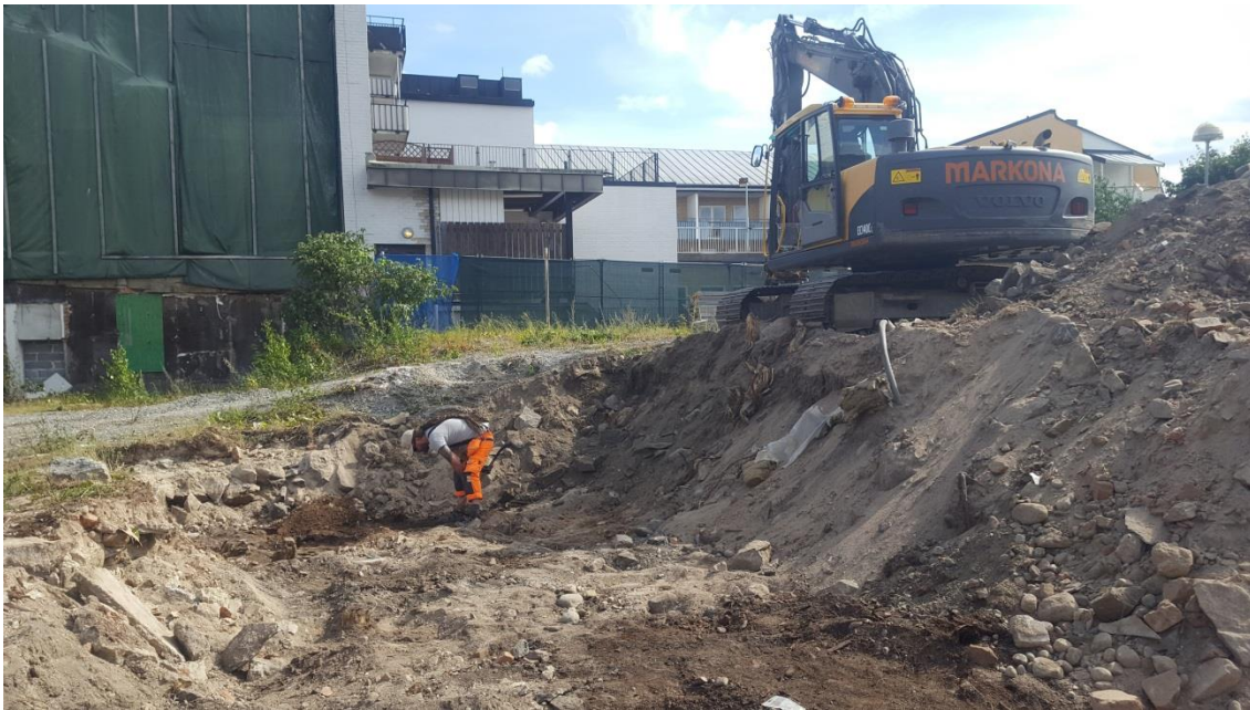
Bild 2: Förberedelserna är i full gång på tomten. Stadshotellets gamla grundmurar plockas bort. En arkeolog övervakar så att inget av historiskt värde skadas.