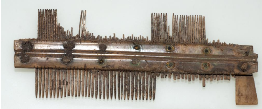
Bild 1: Medeltida kam från 1200-1300-tal. Kammar är föremål som hjälper arkeologerna att navigera bland de historiska tidsskikten eftersom de ofta ändrade utseende. Kammen hittades på tomten under förundersökningen 2010.