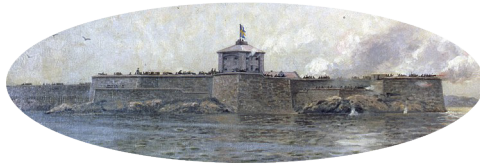
◀ Nya Älvsborgs fästning. Sjöfartsmuseet Göteborg (PDM)