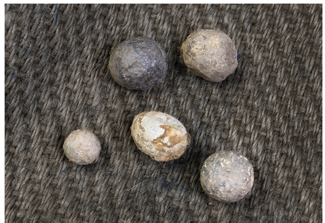
De här musköt kulorna hittade arkeologerna alldeles innanför Göteborgs fästningsmur. Musköt var en sorts skjutvapen. Foto: Markus Andersson för Arkeologerna (CC-BY)

▲ För tvåhundra år sedan revs Göteborgs fästning. Men några små delar finns fortfarande kvar, vid till exempel Esperantoplatsen. Arkeologerna (CC-BY)