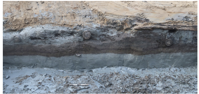
Lagren av jord och lera under marken är också en källa. De här lerlagren med rester av trästockar var en gång en del av Göteborgs befästning.

Det är dyrt att skicka arkeologiska fynd till laboratorier. Det går inte att analysera allt. En risk