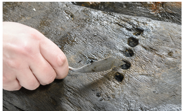
En del av ett vrak rengörs, innan det blir fotograferat, beskrivet och laserskannat. Vraket sparas inte. Bilderna och beskrivningarna är det enda vi har kvar.