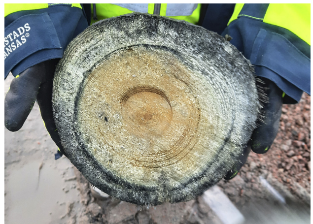
Genom att mäta årsringar i en bit av en avsågad trädstam kan man ta reda på hur gammalt ett träföremål är. Det beror på att årsringarna är olika breda olika år. Metoden kallas dendrokronologi. Arkeologerna (CC-BY)