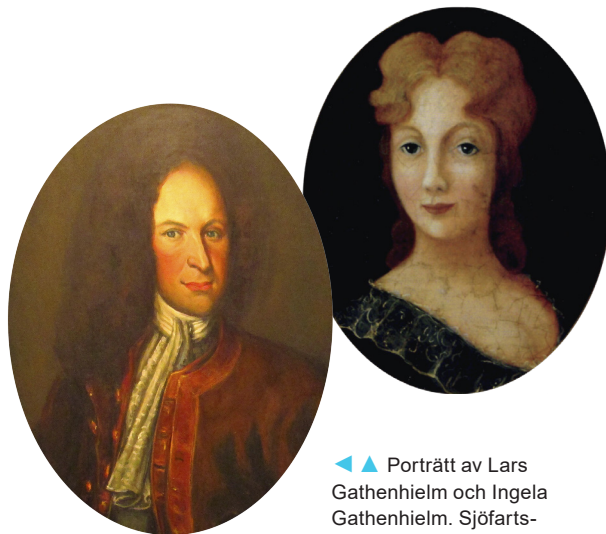
◀ ▲ Porträtt av Lars Gathenhielm och Ingela Gathenhielm.

På ön Madagaskar utanför Afrika fanns vid den tiden ett sjörövarsamhälle, som var nästan som ett eget land. Sjørövarna ville gärna ha skydd av ett annat land, och förhandlade med Sverige om ett avtal. Sjørövarna skulle få skydd. Sverige skulle få tjugofem skepp med sjörövarare som hjälp mot sina fiender. Planen var att det skulle finnas en sjörövarbas i Kungsbacka, Marstrand eller Majorna. Den svenske kungen, Karl XII, lockades av fördelarna. Men han såg också risker med att lita på sjörövarna. Det var inte säkert att de skulle följa reglerna för kapare. Sedan dog Karl XII. Därför blev det aldrig någon sjörövarbas i Majorna.