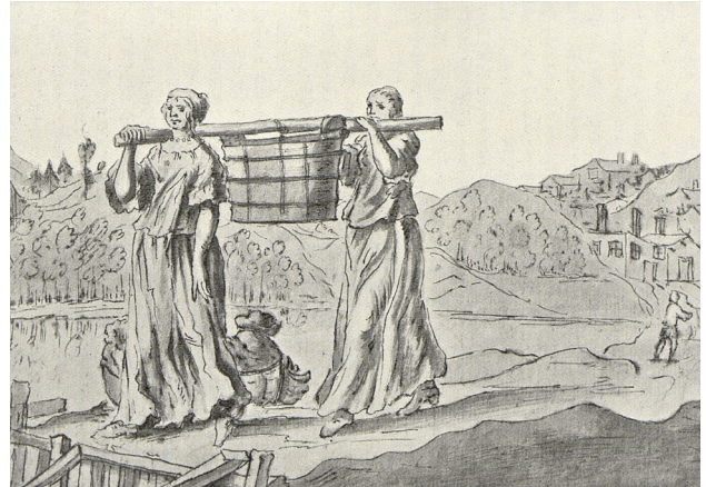
▲ Kvinnor som bär vatten. Magalotti.

om alla skötte sitt och lydte dem som bestämde. Åtminstone tyckte de rika och mäktiga det.