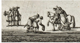
◀ De fattiga fick böja sig för de rika. Dahlbergh.