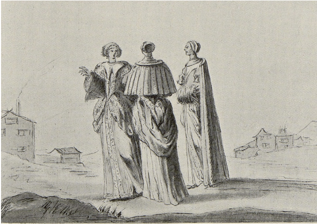
▲ Borgarfruar. Magalotti. Kungliga biblioteket (PDM)