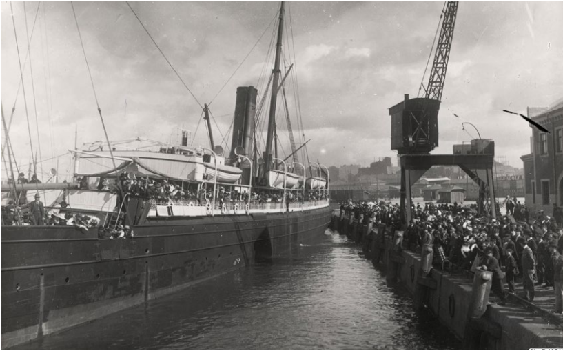
Ett fartyg med utvandrare lämnar Göteborg runt år 1900. Folket ombord är på väg till Amerika.