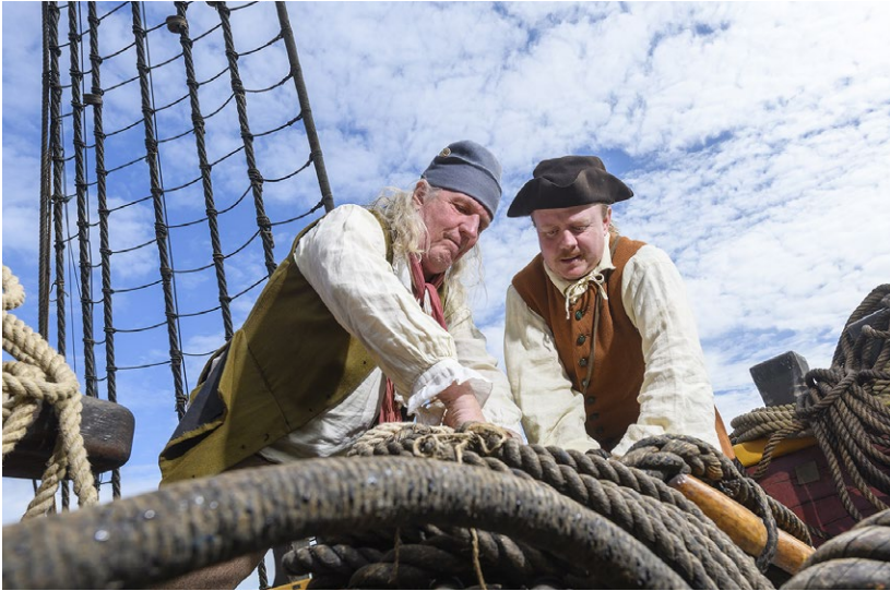
Smugglare till sjöss. Bilden är tagen på den nutida ostindiefararen Götheborg.