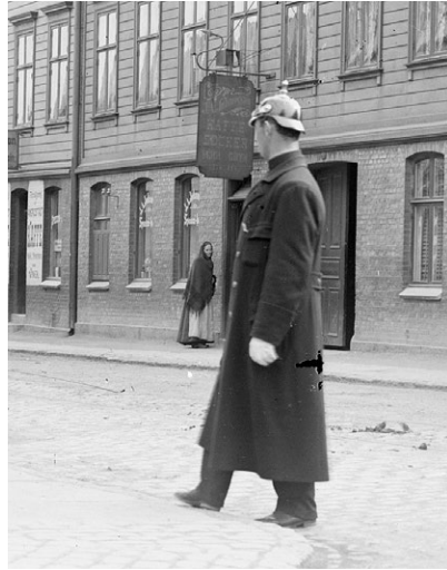
En polis patrullerar gatorna i Göteborg.