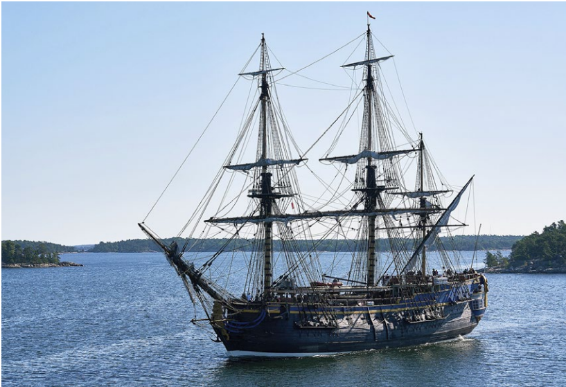
Ostindiefararen Götheborg är en modern kopia av skeppet från 1700-talet.

Smuggling var vanligt på 1700-talet. Ja, inte bara då, förresten. Men om det fanns smugglare på ostindiefararen Götheborg, så smet de undan utan att lämna några spår till eftervärlden.