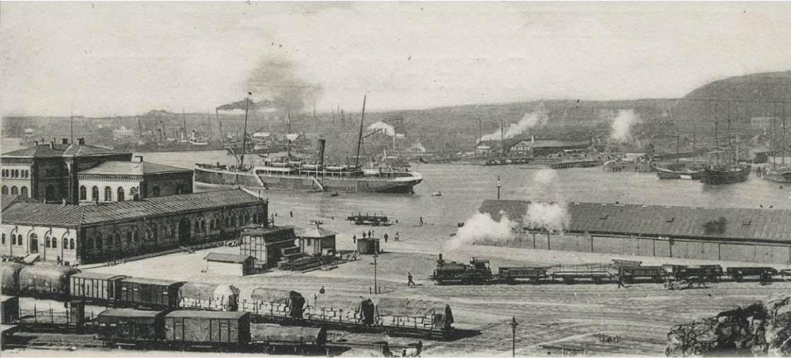
Packhusplatsen år 1896.